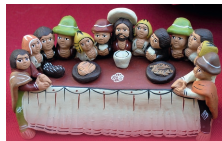
Bram Veerman - Beeldengroep Argentinië

Het simpele gerei, het brood, dat is gesneden, de stilte de gebeden - Want de avond is nabij.