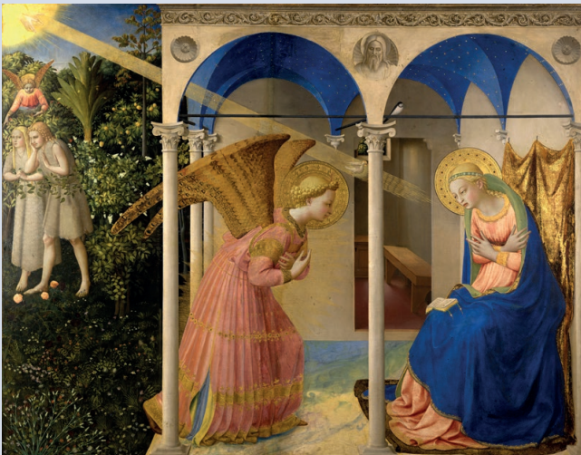
Fra Angelico - Annunciatie