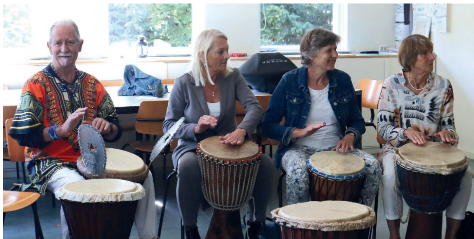
Startzondag 2024 PGLE, Workshop djembé spelen

Johanneshove 10.30 uur pastoor N. van der Peet