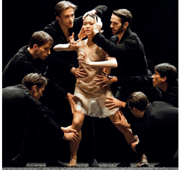
Messa de Requiem – Nationale opera en ballet 2023

In het Requiem van Mozart doet het me denken aan een verzengende adem over de aarde. Bij de Italiaanse operacomponist Verdi lijkt het meer een orkaan die soms verstilt en daarna weer aan komt razen: knallende trommen laten je van de stoel opspringen en koperblazers roepen de doden uit hun graven om zich te melden voor de goddelijke rechtbank.