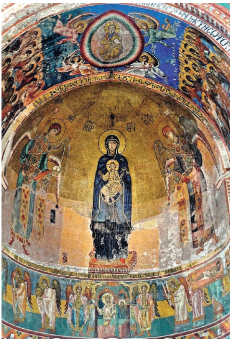
Maria met Kind en engelen, Galatiklooster Georgië (1125-1130)