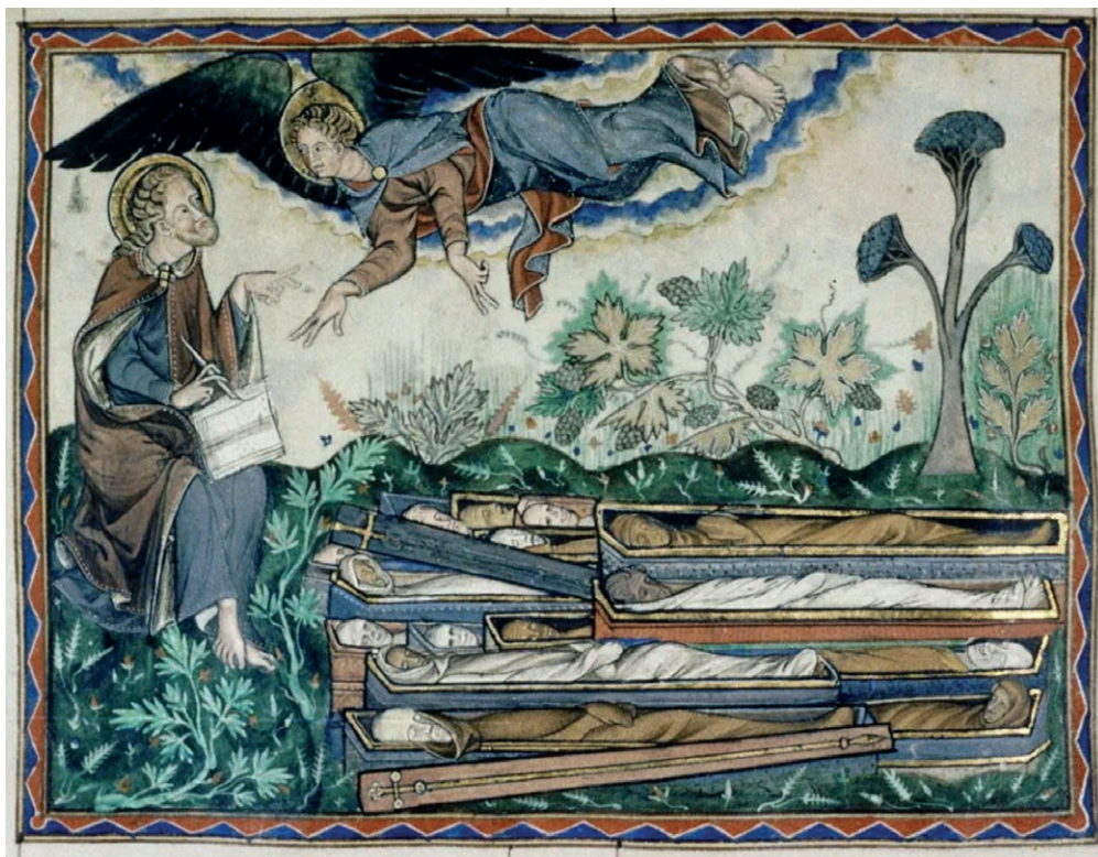
Uit: Bodleian Library, Oxford, Manuscript 180, anoniem.

Ik hoorde een stem uit de hemel zeggen: 'Schrijf op: "Gelukkig zijn zij die vanaf nu in verbondenheid met de Heer sterven."' En de Geest beaamt: 'Zij mogen uitrusten van hun inspanningen, want hun daden vergezellen hen.'