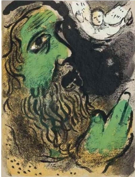
Biddende Job - Marc Chagall 1960

Als het in de bijbel gaat over de opstanding en eeuwig leven worden we niet opgeroepen tot het speculeren over dingen die wij niet weten, maar tot Godsvertrouwen. Ieder die leeft weet één ding zeker, dat is eens te zullen sterven. Maar in het geloof is dit besef niet bedoeld om een verlamme schaduw te werpen. Integendeel, de kwaliteit van het leven licht op in het perspectief van Gods altijd weer komende koninkrijk.