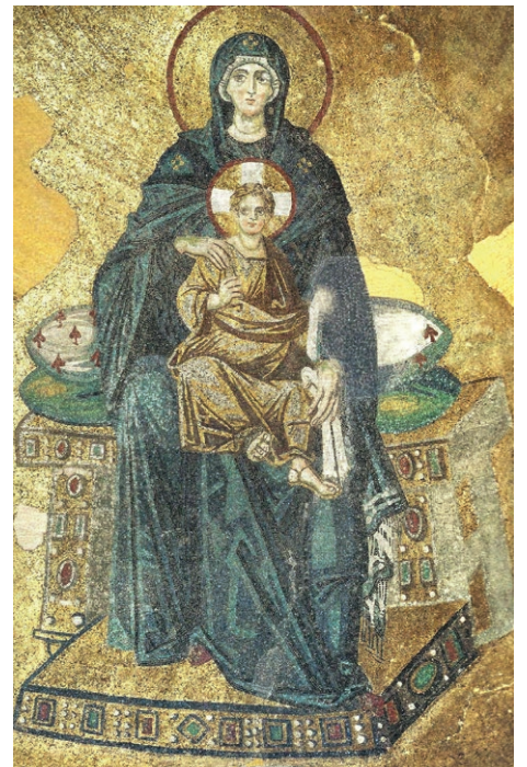
Moeder Gods en het Christuskind, Aya Sofia, Istanbul

Geen voor de hand liggende keuze om juist het Johannesevangelie te volgen als leidraad op weg naar Kerstfeest. Het vierde evangelie heeft immers geen kerstvertelling, maar begint met de fascinerende bespiegeling over het vlees worden van het Woord van God. Waarom vraagt de evangelist ons de Zoon van God als een mens te herkennen? We gaan op zoek naar de waarheid die in Christus wordt gevonden.